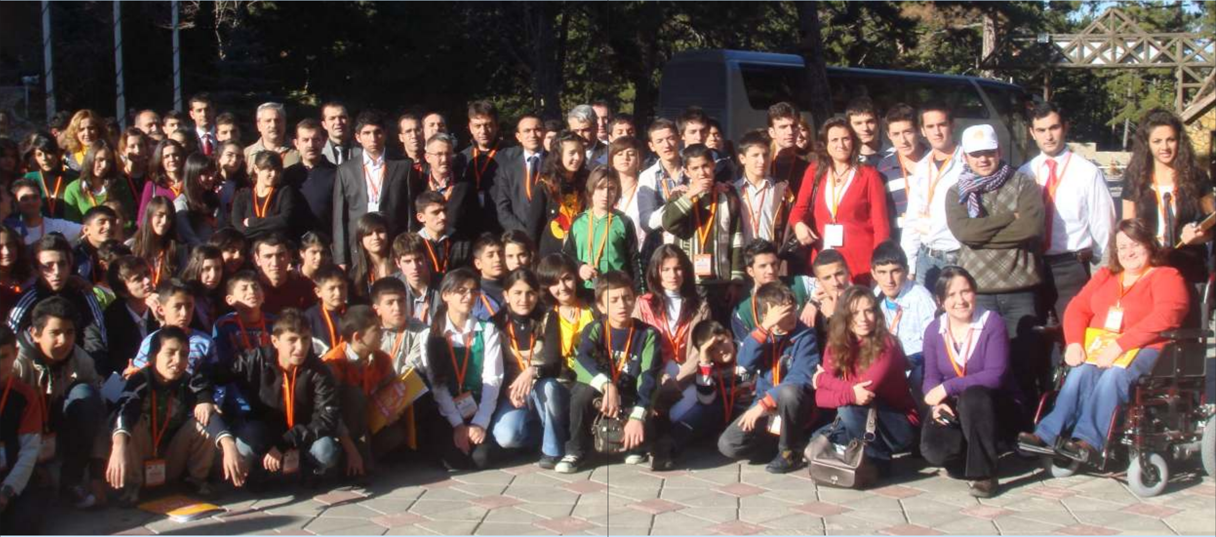
X. Çocuk Forumu, 18-20 Kasım 2009, Ankara